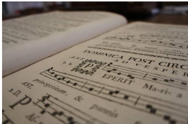
L'un des antiphonaires du fonds des Pénitents Noirs