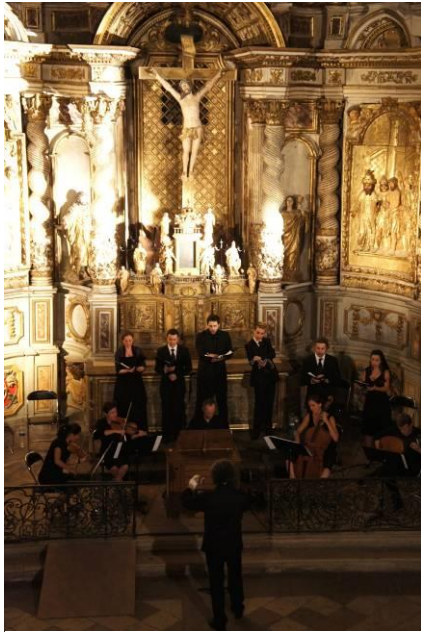
« Amours Sacrées, Amours Profanes », 14 août 2012

L'ensemble Antiphona se consacre à mettre en lumière des œuvres inédites ou méconnues du répertoire baroque méridional avec pour ambition de les diffuser auprès d'un large public. Il reçoit le soutien du ministère de la Culture et de la Communication– Direction Régionale des Affaires Culturelles de Midi–Pyrénées, de la région Midi Pyrénées, du Département de la Haute–Garonne et de la Ville de Toulouse.