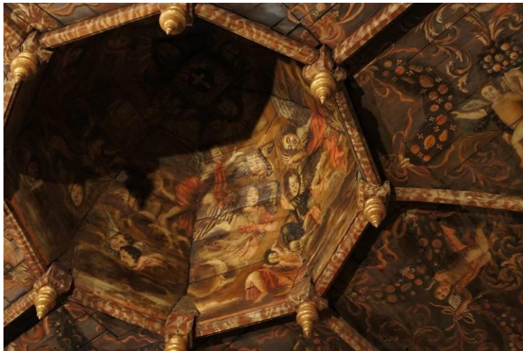
Le plafond peint de la chapelle des Pénitents Noirs

Les résultats encourageants du premier festival – solde financier positif, satisfaction des spectateurs, presse favorable – nous permettent de présenter en 2013 une deuxième édition plus conséquente et plus ambitieuse qui va proposer au grand public la confrontation de deux esthétiques – baroque et moderne – autour d'un même ancrage culturel.