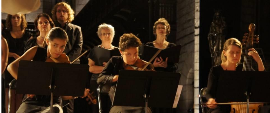
Concert du 9 août 2012

Œuvres pour chœur et orchestre de Marc-Antoine Charpentier, Guillaume-Gabriel Nivers, André Campra ; Partitions anonymes des Pénitents Noirs de Villefranche de Rouergue : Magnificat, Cantate Domino.