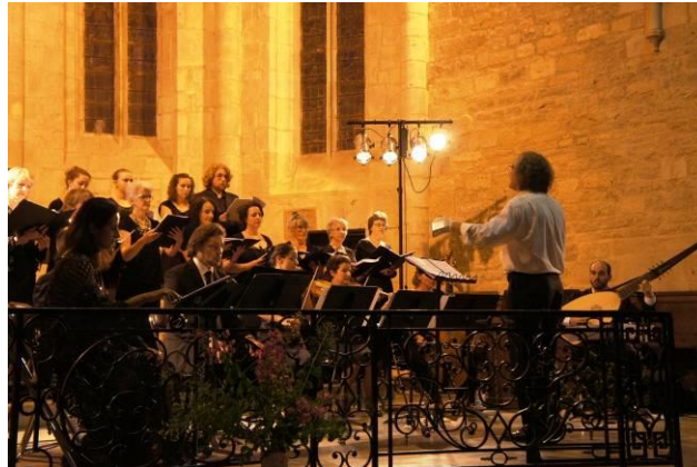
Le chœur du festival et l'Ensemble Antiphona à Caylus, 10 août 2012

Les retours favorables de la presse et du public nous ont encouragés à poursuivre.