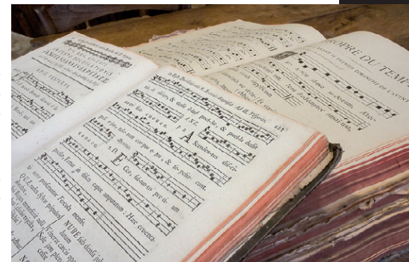
Demandez le Programme

Magnificat, Cantate Domino , motets en tous genres ou œuvres concertantes sont peu à peu sauvés de l'oubli par un travail musicologique et rendus au public.