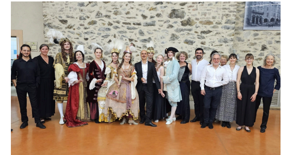
Stages Musique, Danse et Chant 2024

Si vous préférez un logement en hôtel, gîte, chambre d'hôtes ou camping, nous vous conseillons de consulter l'Office de Tourisme de Villefranche de Rouergue : https://www.ouest-aveyron-tourisme.fr contact@ouest-aveyron-tourisme.fr Téléphone : 05 36 16 20 00